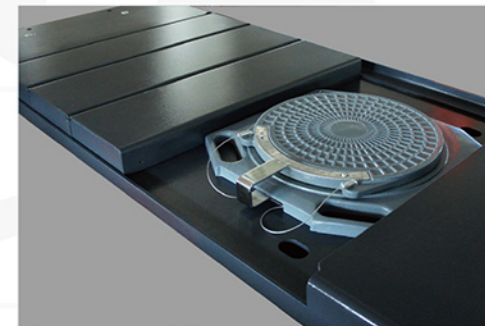
转角盘(选配) 转角盘位置可调，适用于不同轴距的车辆，转角盘转向灵活，精度高、耐磨损。