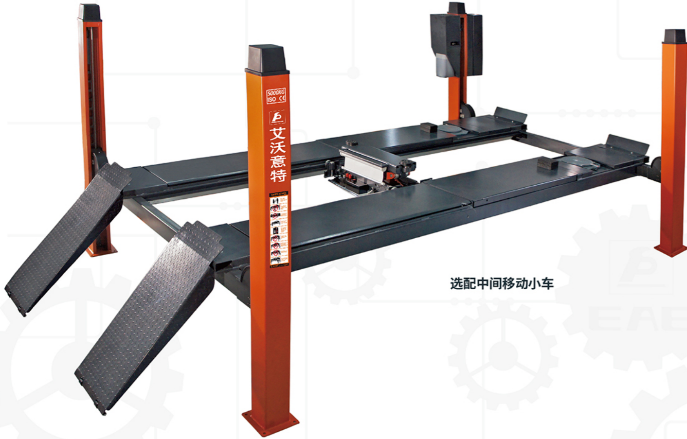
选配中间移动小车