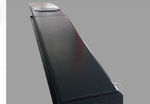
高精度侧滑，能满足3D四轮定位的要求