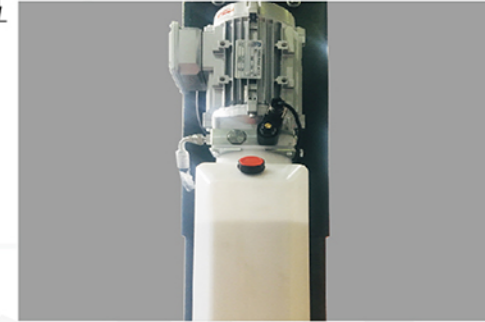
铝壳电机，耐用，散热快